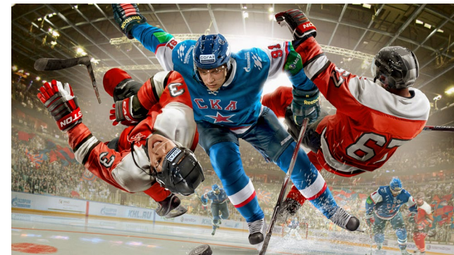
.. the strong ..