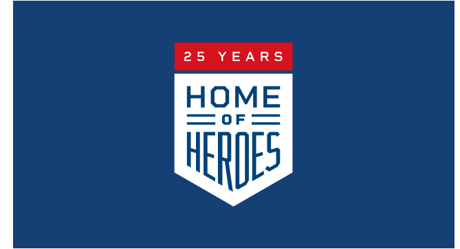
It's the ICE Hockey League. Home of Heroes.