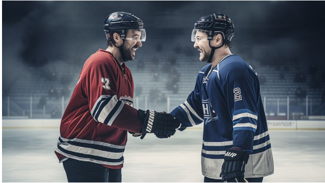
.. and virtue.