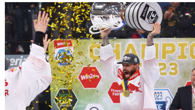
home of glory ..