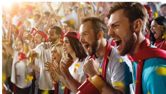
it's home to brothers and sisters