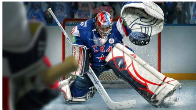
Home of the brave ..