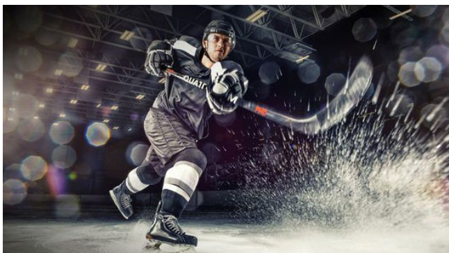
.. the fast ..